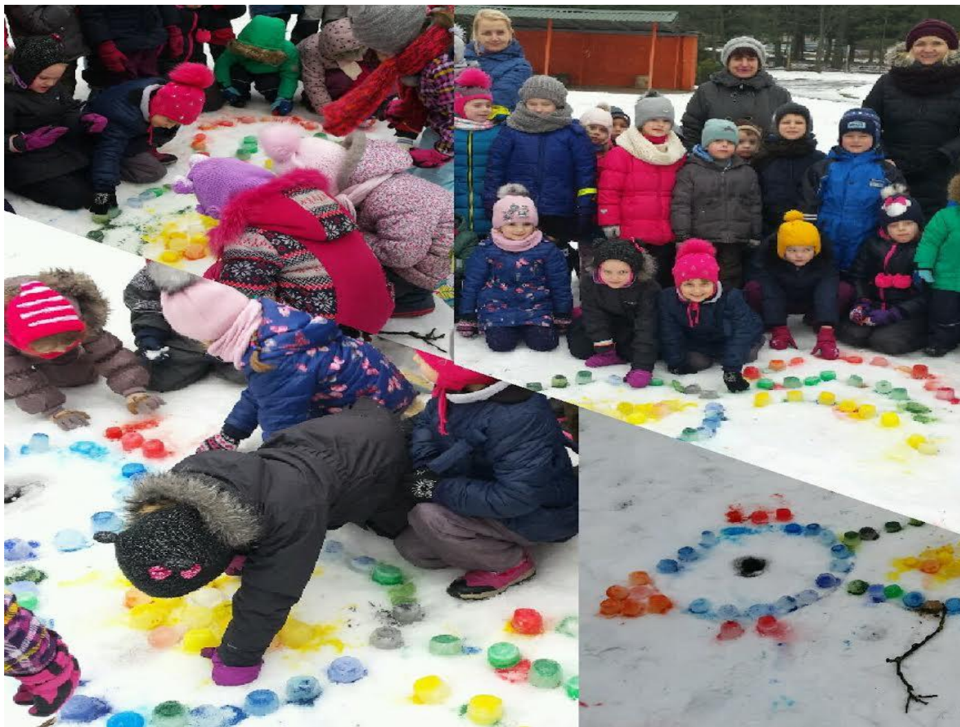
Kauno lopšelis-darželis „Smalsutis“

Vaikai, jų tėveliai, pedagogai bendradarbiaudami tapo aktyviais olimpiados dalyviais. Buvo pasiūlyta įvairių kūrybiškų priemonių talismanui sukurti, motyvuojanti aplinka, vaikai praturtino patirtį aktyviai ir smagiai veikti, rungtyniauti, patirti sėkmę Ikimokyklinukų olimpinių žaidynių metu: akmenslydyje, rogučių varžybose.