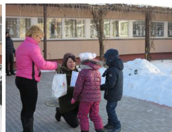
L/d „Šilo“ talismanas